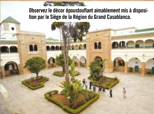
Observez le décor époustouffant aimablement mis à disposition par le Siège de la Région du Grand Casablanca.